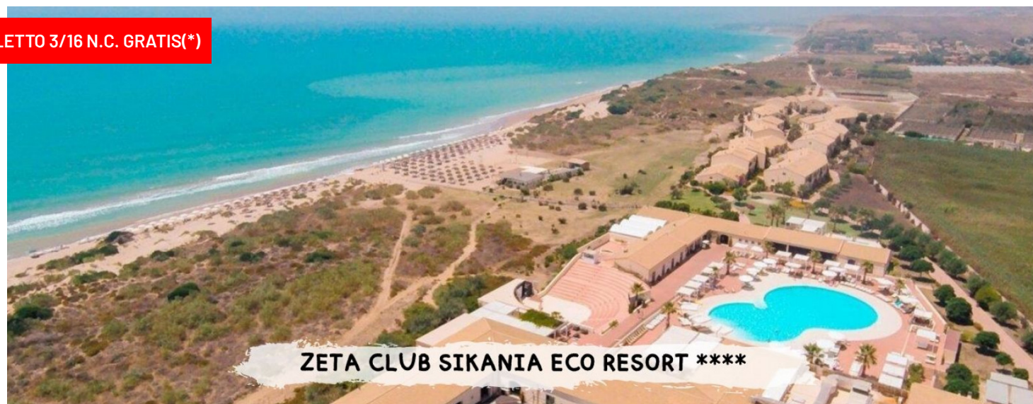
ZETA CLUB SIKANIA ECO RESORT ****

Quote a persona in doppia classic soggiorno 7 notti -trattamento di pensione completa con bevande ai pasti.