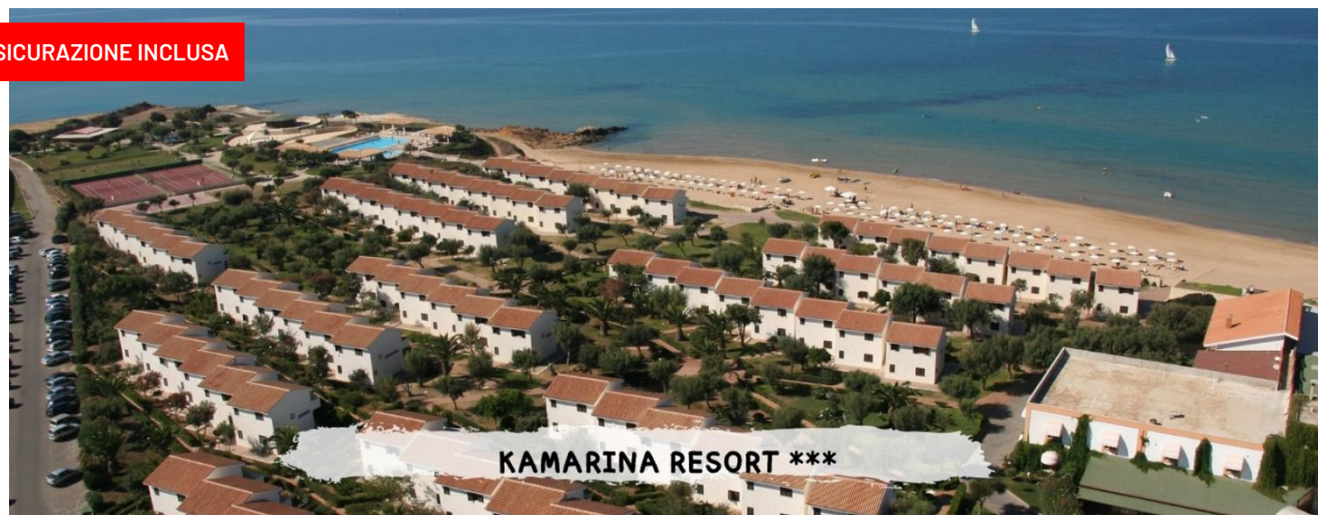
KAMARINA RESORT ***