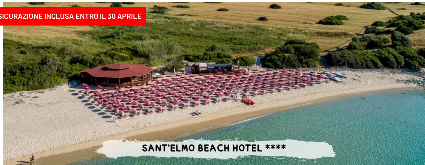
SANT'ELMO BEACH HOTEL ****

ASSICURAZIONE INCLUSA ENTRO IL 30 APRILE