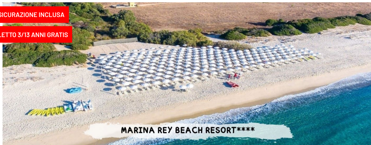
MARINA REY BEACH RESORT****