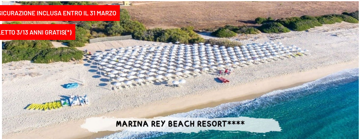
MARINA REY BEACH RESORT****