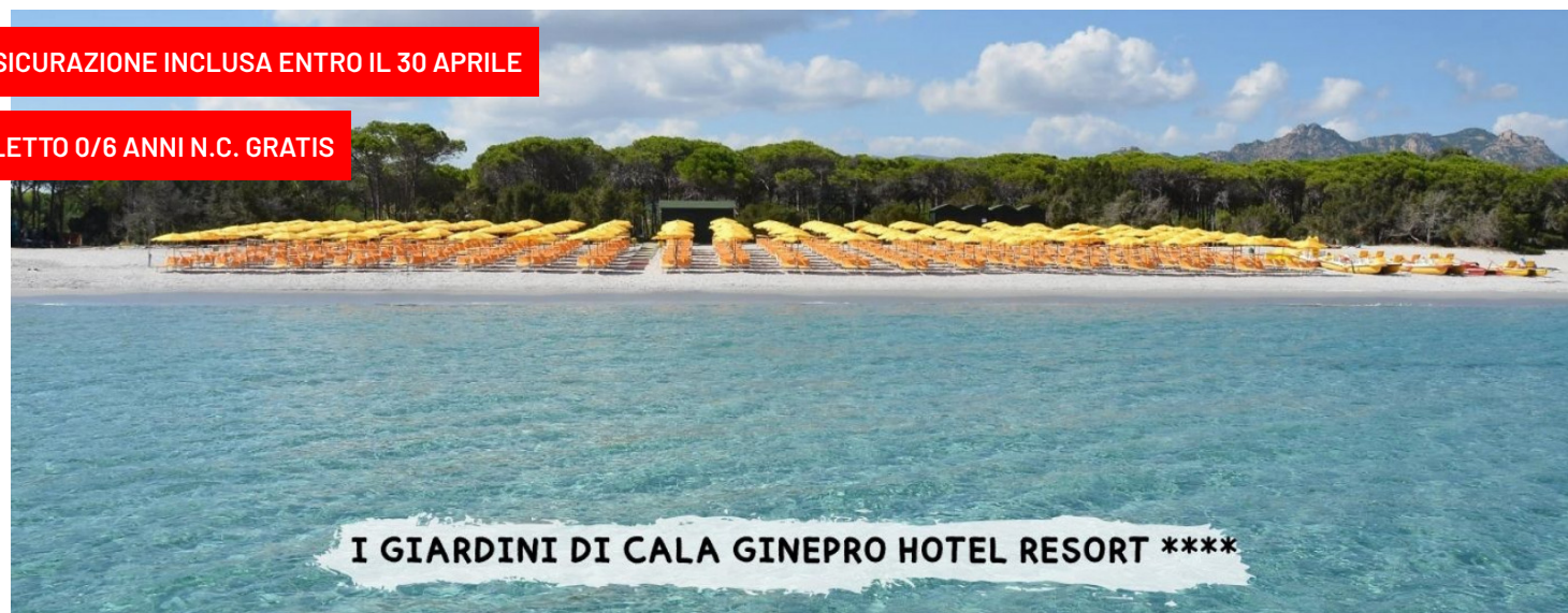
I GIARDINI DI CALA GINEPRO HOTEL RESORT ****