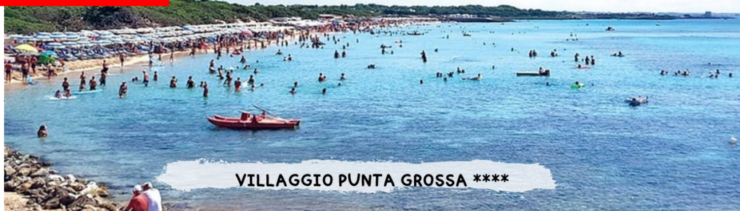
VILLAGGIO PUNTA GROSSA ****