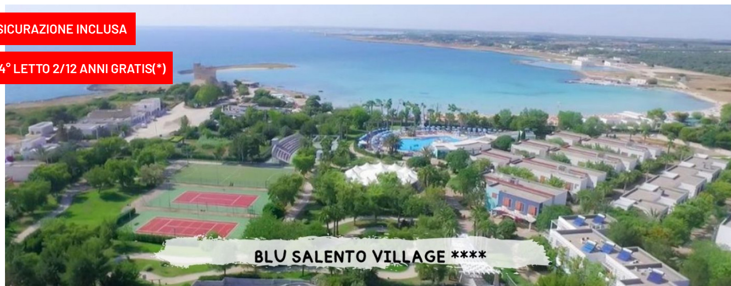
BLU SALENTO VILLAGE ****