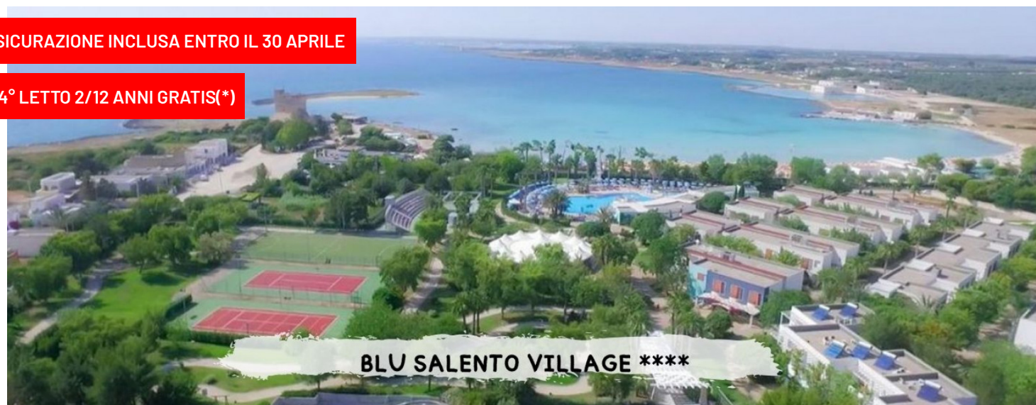
BLU SALENTO VILLAGE ****