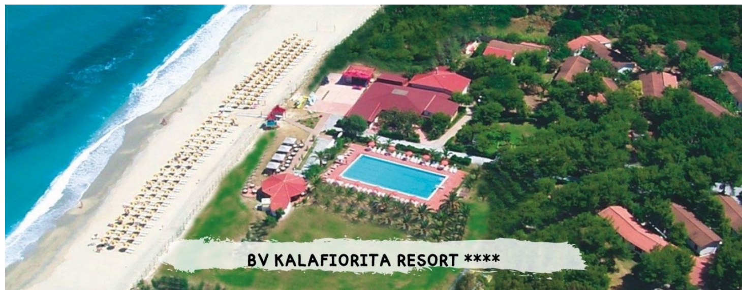
BV KALAFIORITA RESORT ****