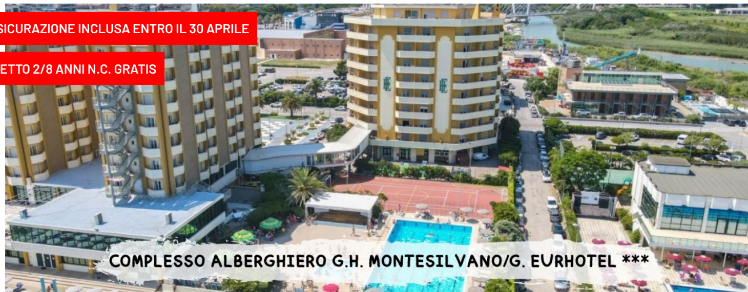
COMPLESSO ALBERGHIERO G.H. MONTESILVANO/G. EURHOTEL ***

quote a persona in pensione completa bevande incluse