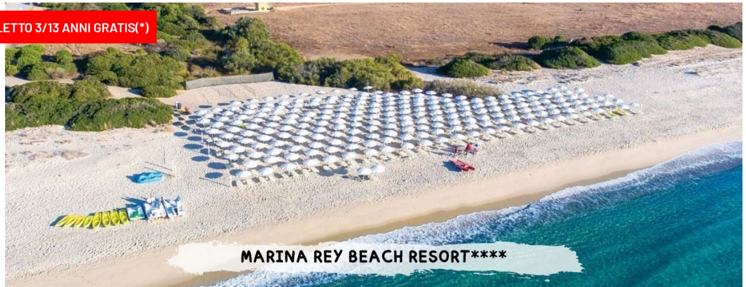
MARINA REY BEACH RESORT****

quote a persona in pensione completa bevande incluse ai pasti