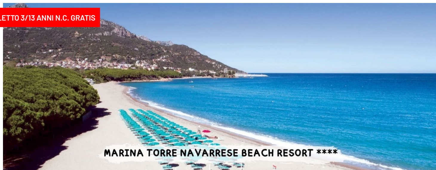
MARINA TORRE NAVARRESE BEACH RESORT ****