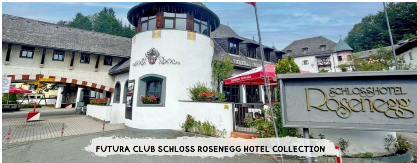
FUTURA CLUB SCHLOSS ROSENEGG HOTEL COLLECTION

Quote espresse in Euro, per persona per settimana in camera standard con trattamento di Pernottamento e 1 a Colazione